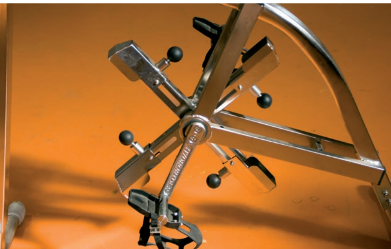
Aspas en forma de cruz.